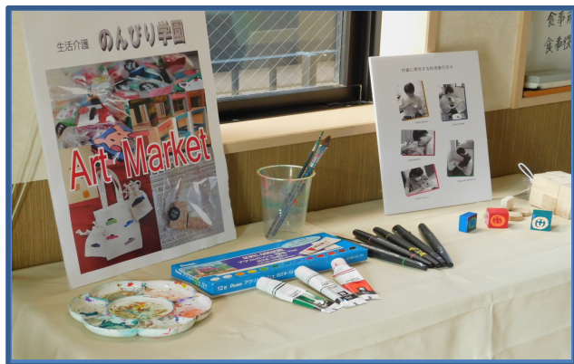
活動名：バザー 日時：R4.11.5

みんなでコツコツ制作しました木工作品等の即売会を開催いたしました！ 利用者の方々の親御さんをはじめ、多くの方々にご来場・ご購入いただきました。今後も沢山の作品を創造していきたいと思いますので、どうぞよろしくお願い致します。