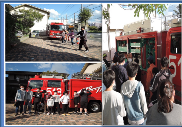
活動名：消防訓練 日時：R4.10.19

今年の忘年会では、ボーリング大会で身体を動かしながら汗を流し、ガストでの昼食会を実施しました★ みんなで少しの非日常体験を楽しみながら、今年一年間を労い、充実して過ごすことができました！