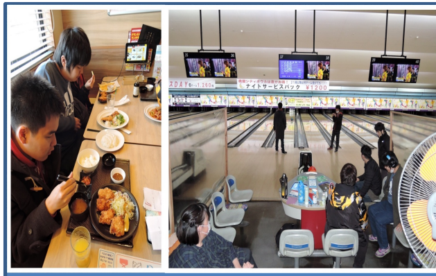
活動名：忘年会 日時：R4.12.9

みんなでコツコツ制作しました木工作品等の即売会を開催いたしました！ 利用者の方々の親御さんをはじめ、多くの方々にご来場・ご購入いただきました。今後も沢山の作品を創造していきたいと思いますので、どうぞよろしくお願い致します。